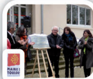
Inauguration du centre d'accueil de la ville de Toulouse

⇒ Le centre d'accueil de la ville de Toulouse se modernise et développe un accueil de groupes hors période Estivale.