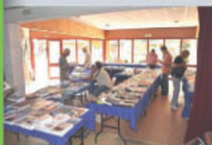
Journées « Livres et Montagne »