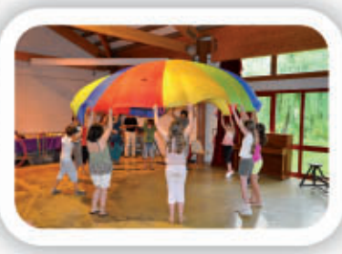
Spectacle de l'association Musicolus

* l'association DPC pour le Développement en Pays Couserans est porteuse de projets, elle a réalisé l'implantation de la « Station Trail », en partenariat avec la communauté de commune Musicolus accueille chaque année une école de musique de la région Toulousaine pour un stage de qualité d'une semaine qui se clôture par un concert offert à tous.