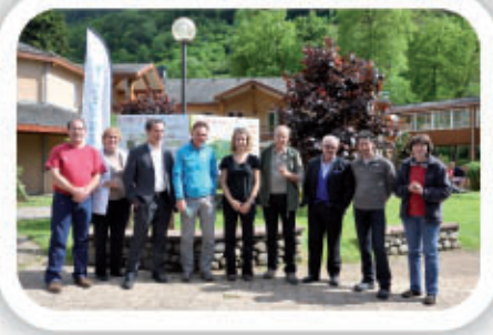
Inauguration de la Station Trail

• Au travers des Groupements Pastoraux, l'activité agricole est soutenue.