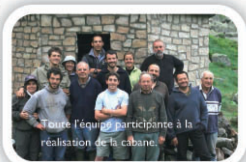
Toute l'équipe participante à la réalisation de la cabane.

truction au « Troun de l'Ars » d'un abri refuge en bois habillé de pierres semblable au « Touec ». Le projet accepté, son résultat est superbement intégré dans le paysage. Bergers, promeneurs, chasseurs et pêcheurs peuvent désormais s'y abriter. Le montage financier a été le suivant : 1/3 Commune, 1/3 sponsoring collecté par les élèves, 1/3 Sociétés de pêche et de chasse.