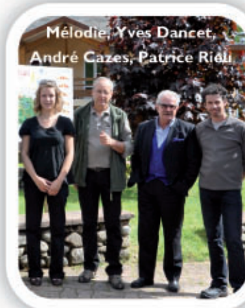
L'équipe du Trail

le projet de traitement de l'obésité des adultes en lien avec le thermalisme,