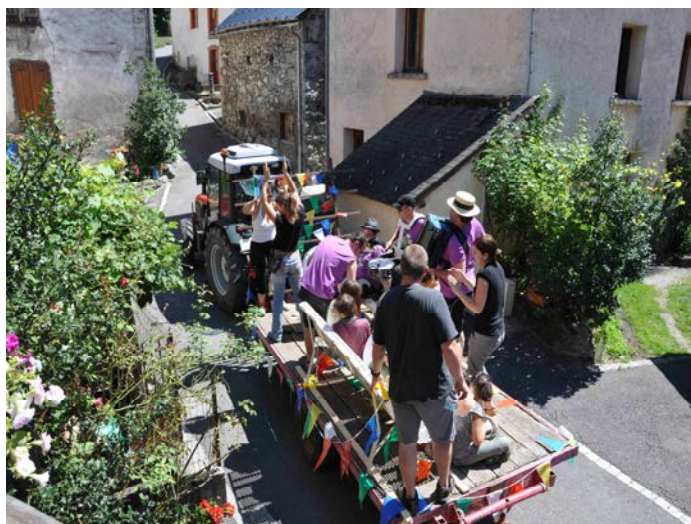
Fête du village