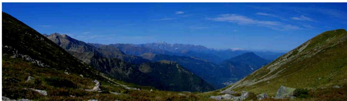
Vue depuis le col des Fouzès

Une première réunion s'est tenue à Aulus avec le cabinet d'architecte que nous avons retenu le 7 Décembre ; une seconde est déjà prévue pour le 11 Janvier 2019. Nous espérons déposer les dossiers de demande de financement pour la fin du mois de Mai. Nous vous informerons du planning de ces réalisations en fonction des prochaines étapes.