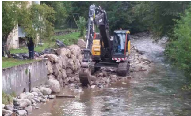
Travaux sur les berges au centre de vacances.