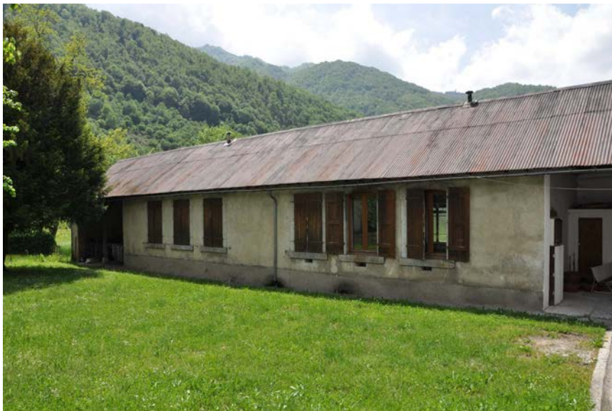
L'école avant sa rénovation