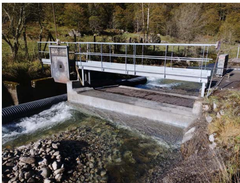
Prise d'eau du Garbet

Pour 2024 des actions de modernisation et de sécurisation des matériels se poursuivront. Elles concernent notamment les organes vitaux comme les deux alternateurs et les contrôles sur les conduites forcées.