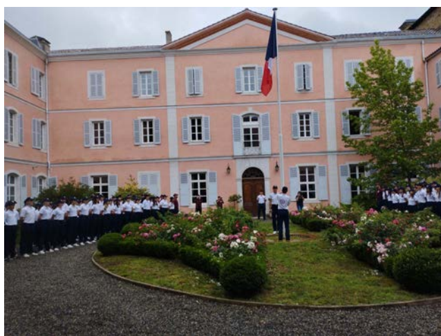
Cour intérieure de la préfecture